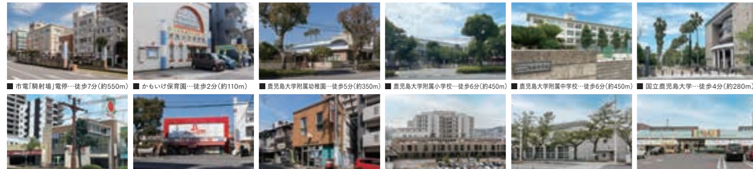
■市電「騎射場」電停…徒歩7分(約550m) ■かもいけ保育園…徒歩2分(約110m) ■鹿児島大学附属幼稚園…徒歩5分(約350m) ■鹿児島大学附属小学校…徒歩6分(約450m) ■鹿児島大学附属中学校…徒歩6分(約450m) ■国立鹿児島大学…徒歩4分(約280m) ■タイヨー 騎射場店…徒歩6分(約450m) ■ドラッグイレブン 騎射場店…徒歩4分(約250m) ■鹿児島県郵便局…徒歩7分(約550m) ■鹿児島市立病院…徒歩4分(約1,200m) ■鴨池公園多目的屋内運動場…徒歩10分(約750m) ■おいどん市場と次郎館…車で6分(約2,200m) ※表示の距離・分数は現地からの地図上の概算距離を示したものです。※徒歩分数は1分を80mとして算出し、端数は切り上げてあります。車分数は1分を400mとして算出し、端数は切り上げてあります。

【物件概要】●名称/ハレ プアラニ 鴨池●所在地/鹿児島県鹿児島市鴨池1丁目20番7(地番)●交通/鹿児島市電「鴨池」電停徒歩6分●用途地域/第一種住居地域●地目/宅地●地域・地区/法第22条区域●建ぺい率/60%●容積率/200%●敷地面積/609.86㎡●建築面積/202.00㎡●延床面積/1,562.34㎡●構造・規模/鉄筋コンクリート造地上13階建●建築確認番号/第ERI-23011972号(2023年6月5日)●総戸数/12戸●駐車場/13台(平面式)(月額使用料/12,000円~16,000円)●駐輪場/10台(平面)(月額使用料/200円)●間取り/2LDK・3LDK●専有面積/101.23㎡(防災倉庫1.92㎡含む)●バルコニー面積/18.60㎡●ポーチ面積/7.89㎡●室外機置場/3.90㎡●分譲後の権利形態/〈敷地〉専有面積割合により所有権の共有(建物)専有部分:区分所有権、共有部分:専有面積割合による所有権の共有●管理形態/区分所有者全員により管理組合を結成し、管理会社に委託していただきます(巡回管理)●インターネット使用料(月額)/1,320円●事業主/売主/株式会社さぼてん開発コーポレーション 宮崎県知事免許(1)第5091号 〒885-0005 宮崎県都城市神の山町4866番地2●販売提携(代理)/株式会社長谷工アーベスト 国土交通大臣(11)第3175号、(一社)不動産協会会員、(一社)不動産流通経営協会会員、(公社)首都圏不動産公正取引協議会加盟 〒105-8545 東京都港区芝二丁目6番1号●設計・監理/株式会社サニム建築事務所 施工会社/株式会社新生組●管理会社/株式会社長谷工コミュニティ九州●建物竣工時期/2024年11月下旬予定●入居時期/2025年1月下旬予定●設計図書閲覧場所/「ハレ プアラニ 鴨池 販売事務所」【先着順販売概要】●販売戸数/11戸●販売価格/6,380万円~8,880万円●最高価格帯/6,600万円(2戸)●管理費/27,000円●修繕積立金/12,150円●管理準備金/40,500円●修繕積立一時金/850,500円●申込受付場所/「ハレ プアラニ 鴨池 販売事務所」●お持ちいただくもの:お認印・身分証明書(運転免許証、健康保険証、パスポートなど)・収入証明書(2023,2022年分の源泉徴収票もしくは直近3カ年分の確定申告書)※先着順受付のため、成約済みとなる場合はご了承ください。●広告作成日/2024年7月14日●お問い合わせ/「ハレ プアラニ 鴨池 販売事務所」/営業時間:10:00~18:00/定休日:毎週水曜日・木曜日(祝日除く)